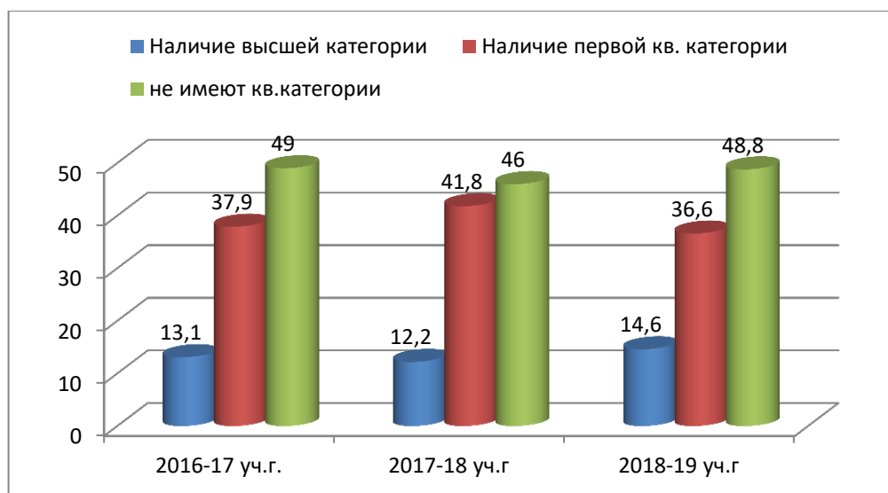
Диаграмма 2. Динамика уровня квалификации педагогов муниципального района за три учебных года

Анализ мониторинга позволяет сделать следующий вывод : наблюдается увеличение процентного показателя количества педагогов, имеющих высшую квалификационную категорию за счет снижения показателя первой категории. Остается относительно стабильно высоким процентный показатель педагогов, не прошедших аттестацию. Как свидетельствует ежегодный мониторинг, основной причиной сложившейся ситуации является приток молодых педагогов в образовательные организации Таймыра, как следствие – недостаточное накопление результатов профессиональной деятельности для прохождения аттестации на квалификационную категорию.